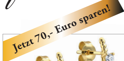
Iloria - Diamant - Halbcreolen 9 Karat Gelbgold, veredelt mit einem im Labor gewachsenen Diamanten von höchster Brillanz, 3 mm x 14 mm, Twisted Design mit Steckerfunktion