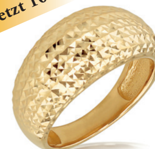
Solonya - Ring 9 Karat Gelbgold, Kieferkuppel Ring mit Diamantschliff, Breite 4,5 mm schmal verlaufend auf 1,5 mm