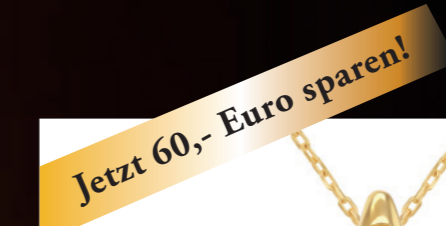
Isalya - Diamant Collier 9 Karat Gelbgold, veredelt mit 9 im Labor gewachsenen Diamanten von höchster Brillanz, Anhänger in Tropfenform (Höhe: 13,4 mm, Breite 6,7 mm), verstellbare Halskette 41 cm, mit Gliedererweiterung zu 43 cm.