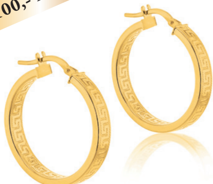
Zaphira - Creolen 9 Karat Gelbgold, 23,5 mm Durchmesser, 4 mm Breite, Versace Design