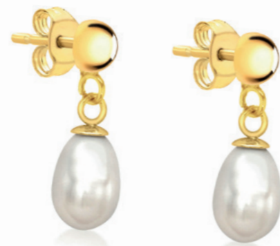
Soraya - Ohrringe 9 Karat Gelbgold, Süßwasserperle 6 x 8 mm, insgesamt 14 mm Höhe, Ohrhänger mit Stecker