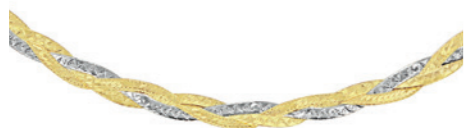
Selaya - Kette 9 Karat, 2-farbiges Gold, 3,5 mm Breite, Diamantschliff, 3-fach-geflochtene Fischgrät-Halskette, Länge: 46 cm Best. Nr. 21660940

Für Momente, die wie italienische Nächte funkeln.