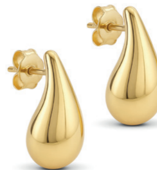
Venara - Ohrstecker 9 Karat Gelbgold, großer tropfenförmiger Ohrstecker, 15,4 mm Breite x 28 mm Höhe Best. Nr. 15595420