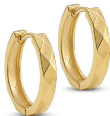
Elarine - Creolen 9 Karat Gelbgold, facettierte große Creolen, 19,5 mm Durchmesser