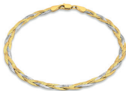
Carenia - Armband 9 Karat 2-farbiges Gold 3 mm Breite Diamantschliff 3-fach geflochtenes Fischgrät-Armband 19 cm Länge Best. Nr. 22660920