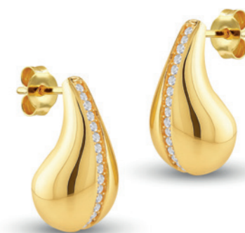
Aurelia - Diamant Ohrstecker 9 Karat Gelbgold, veredelt mit 36 im Labor gewachsenen Diamanten von höchster Brillanz, mittig gefasst, Ohrring in Tropfenform, Größe: 19 x 10,3 mm Best. Nr. 15595430