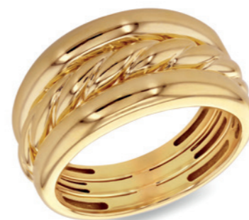
Velmira - Twist Ring 9 Karat Gelbgold, 3 mm Breite, verlaufende Unterseite 2 mm in Twist -Form