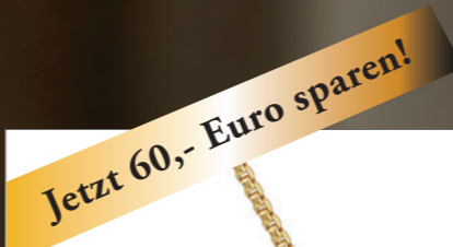
Ravela - Collier 9 Karat Gelbgold, tropfenförmiger Anhänger mit 18 mm Höhe, Kette 43 cm mit Verlängerung