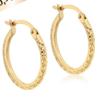
Caliora - Creolen 9 Karat Gelbgold, 18 mm Durchmesser mit Diamantschliff