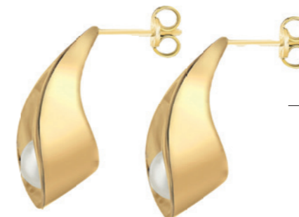
Nolena - Ohrringe 9 Karat Gelbgold, 5 mm Süßwasserperle, Höhe 16,5 mm, Ohrhänger mit Stecker