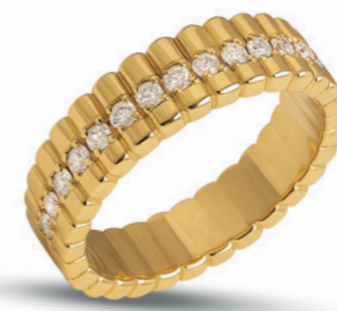
Lunara - Ring 9 Karat Gelbgold, 5,8 mm Ringbreite, veredelt mit 16 im Labor gewachsenen Diamanten von höchster Brillanz - rund verlaufend