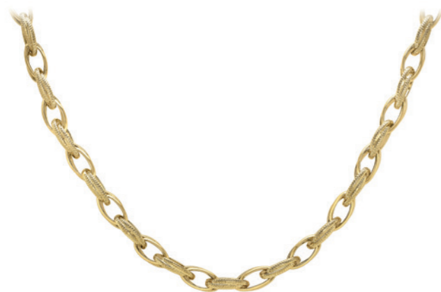
Oravelle - 'Prince of Wales' Kette 9 Karat Gelbgold, mit strukturierten und glatten Gliedern, 6,2 mm Breite, 46 cm Länge