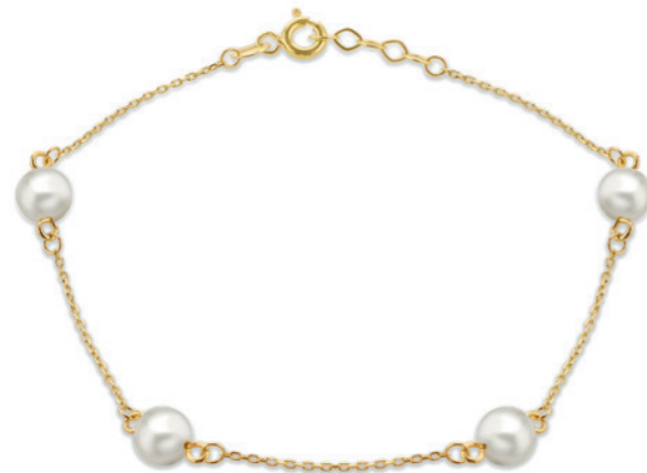
Aveline - Perlen Armband 9 Karat Gelbgold, 4 Süßwasserperlen (ca. 6 mm Durchmesser) mit verstellbaren Armband 19 cm Länge