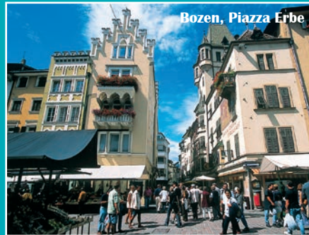
Bozen, Piazza Erbe