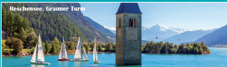
Reschensee, Grauner Turm

1. Tag: Anreise: Fahrt ins Südtirol, über Sterzing nach Brixen, mit einem Aufenthalt zur gemütlichen Besichtigung. Anschl. Fahrt zum 3*-Hotel Senoner, an ruhiger Lage im Ortszentrum von Spinges. Zimmerbezug, ansch. Abendessen.