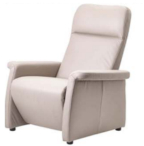
MOTION 3 MOTION 4