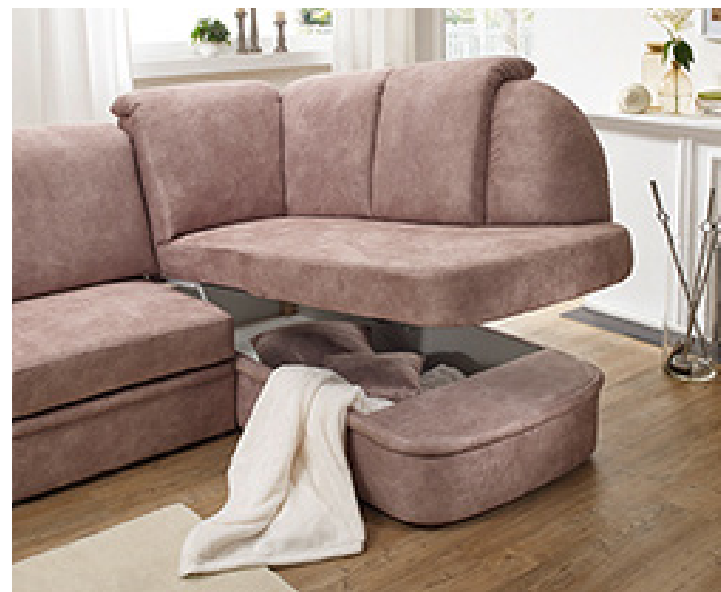
aufklappbare Ottomane (optional)