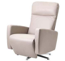
MOTION 1 MOTION 2