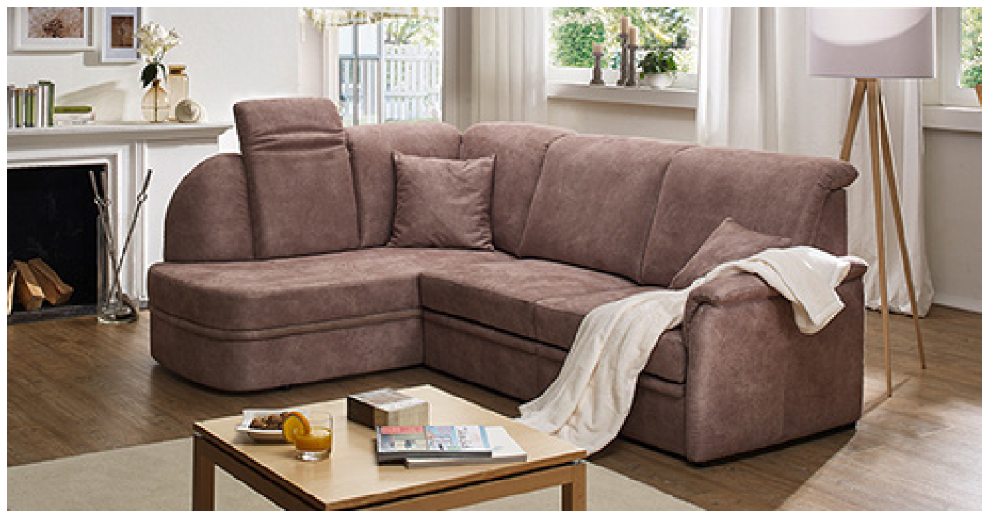
komfortable Kopfteilverstellun (optional)

Beste Voraussetzungen für rundum entspanntes Sitzen!